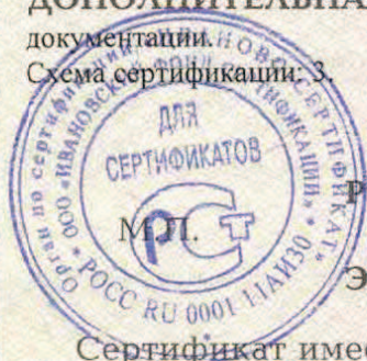
Схема сертификации: 3.

ДОПОЛНИТЕЛЬНАЯ ИНФОРМАЦИЯ Место нанесения знака соответствия: в товаросопроводительной документации.